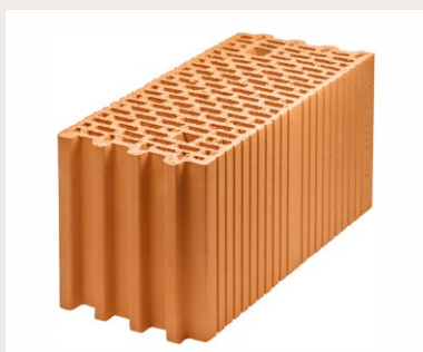
Nr artykułu 2826