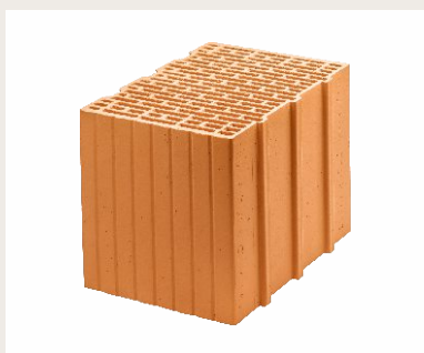
Nr artykułu 1310