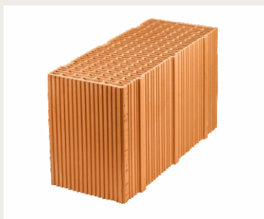
Nr artykułu 0912