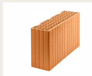
Nr artykułu 1005