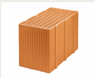
Nr artykułu 0910