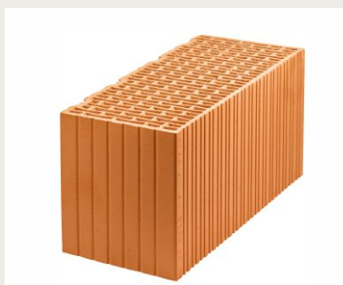
Nr artykułu 0815