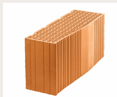
Nr artykułu 0813